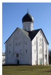
Храм Спаса Преображения на Ильине улице, Великий Новгород.

Первой работой Феофана считается роспись церкви Спаса Преображения на Ильине улице в Новгороде. О ней упоминается в Третьей Новгородской летописи: «В лето 6886 (1378 год от Р. Х.) подписана бысть церковь Господа Бога и Спаса нашего Иисуса Христа во имя боголепного Преображения ... А подписал мастер греченин Феофан». К сожалению, роспись сохранилась не полностью, но и в таком виде она поражает удивительным живописным мастерством и свободой. А неординарность образов свидетельствует о знакомстве автора с учением исихастов, монахов-мистиков, в основу духовной практики которых было положено созерцание нетварного Фаворского света.