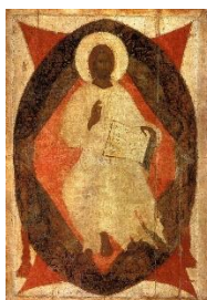
Деисус. Феофан Грек

Необычно трактована на этой иконе мандорла — сияние славы вокруг Христа, она написана темно-синим цветом. Это находит объяснение в исихастской традиции. Отцы-исихасты учили о непознаваемости Бога рациональным умом, и Божественный Свет называли «умонепостижимым мраком» или, по выражению свт. Григория Паламы, — «сверхсветлой тьмой». Непроступный свет часто воспринимается человеком как слепящая темнота. Встреча с ним многими подвижниками воспринималась как вхождение во мрак. Вспомним, что Павел на пути в Дамаск был ослеплен этим Светом (Деян 22:6–11 ). На противопоставлении света и тьмы, жизни и смерти, божественного и человеческого строится образ Успения как рождения в новую жизнь.