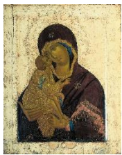
Донская икона. Феофан Грек

обходится без внешне экстравагантных приемов, как это было в новгородских фресках, но при этом создает образ, исполненный красоты и духовной силы.