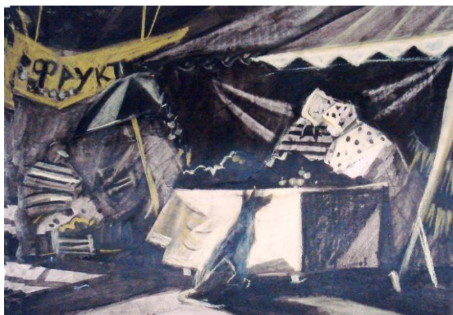
2. Образцы работ учащихся школы по заданной теме.